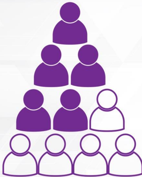
CP DESPUÉS DE 1 SEMANA DE MUESTRAS