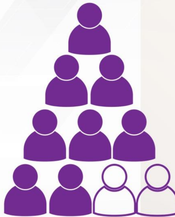
CP DESPUÉS DE LA 2a SEMANA DE MUESTRAS