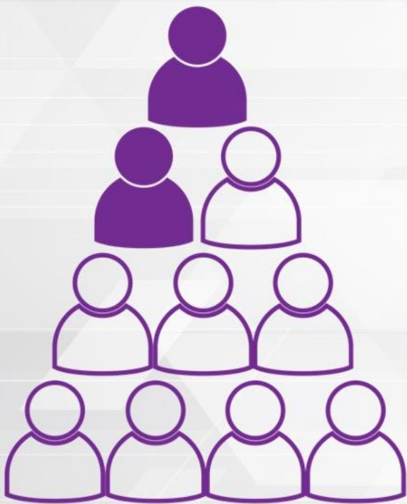
CP CON LA 1a OFERTA